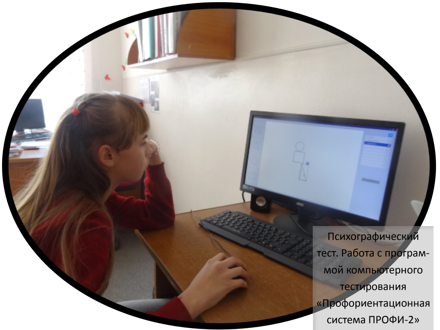
Психографический тест. Работа с программой компьютерного тестирования «Проориентационная система ПРОФИ-2»