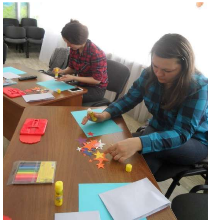
Создание «Семейной Галактики»