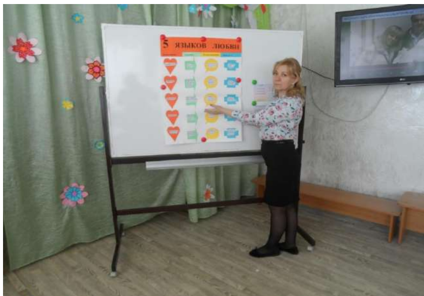
Мини-лекция «5 языков любви»