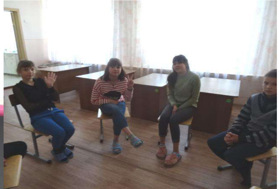
Чтение писем подростков из журнала «Мы» рубрика «Проблема из конверта»