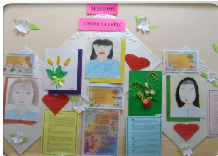
Моя мама – лучшая на свете