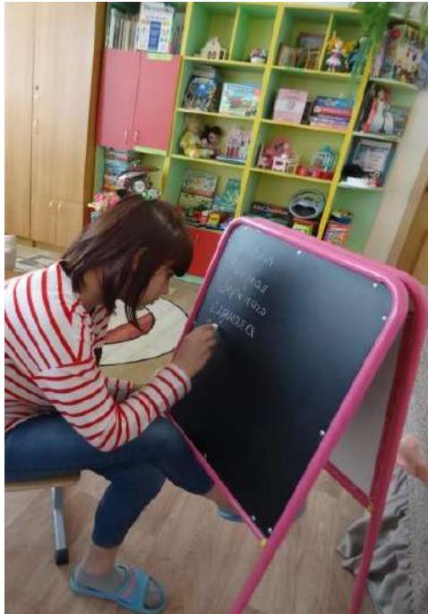
Тест «Искусство жить с родителями»