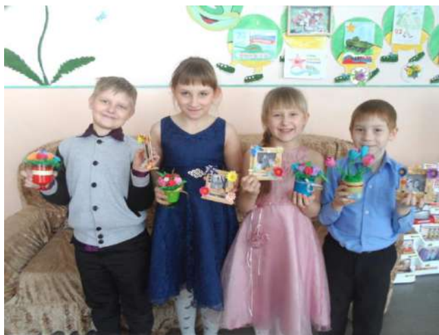
Подарок для мамы