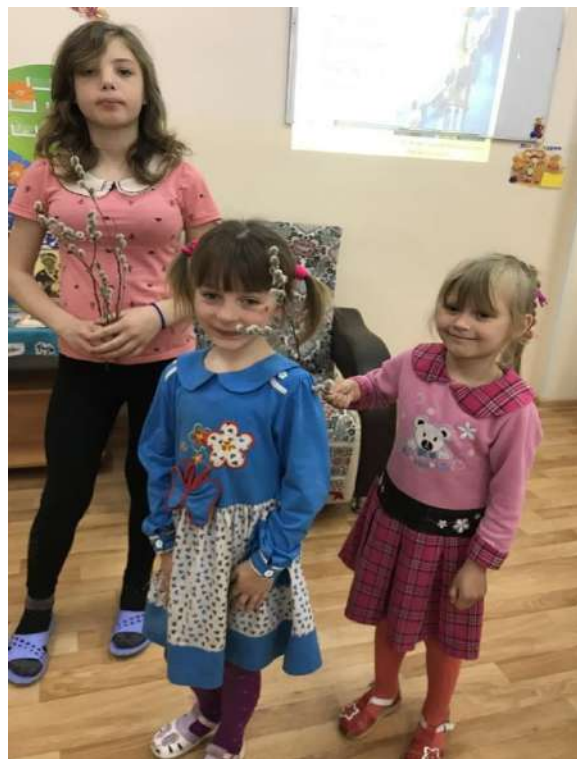
Знакомство с праздником